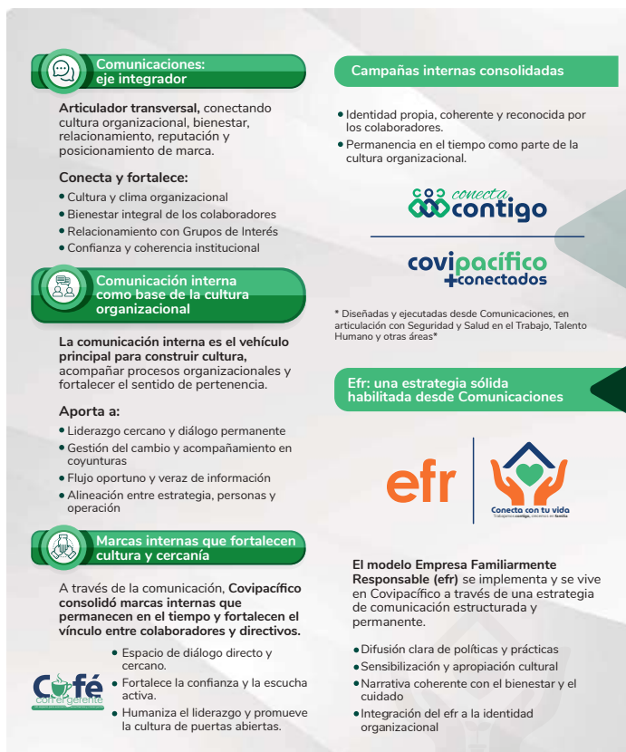
Figura 16. La comunicación habilitador del modelo de sostenibilidad

Este enfoque integral se representa en la Figura 17, que resume cómo la comunicación, desde su rol articulador, habilita e impulsa el modelo de sostenibilidad en Covipacífico, conectando cultura organizacional, bienestar, reputación, y relación con los grupos de interés.